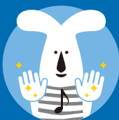
こまめな手指消毒

●出発前にご自宅で検温し、37.5℃以上の発熱があった場合、また5日以内に平熱を超える発熱をされた方はご来場をお控えください。(新型コロナウイルス感染症陽性と判明した方と濃厚接触された方もご来場をお控えください。) ●会場入口で検温と手指消毒をさせていただきます。37.5℃以上のお客様には入場をご遠慮いただきます。あらかじめご了承ください。 ●会場ではソーシャルディスタンスを確保し、密接、密集した会話は控えさせていただきます。 ●万一の感染者発生に備え個人情報を収集させていただきます。ご予約の際に氏名、緊急連絡先等お伺いいたします。感染者が発生した場合、要請に応じて会場や公的機関へ情報が提供されることがありますので、あらかじめご了承ください。 ●ご予約、ご来場くださいませ。なお個人情報は公演1ヶ月後に破棄いたします。